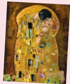
Poster "Der Kuss" (Gustav Klimt) "The Kiss" poster (Gustav Klimt)

Vienna Duty Free [22, 41, 45, 61] Gates F & G