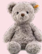
Kuscheltier Stuffed animal

Senses of Austria [31, 38, 46] Gates F & G