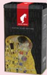
Julius Meinl Kaffee Julius Meinl coffee Vienna Duty Free [22, 41, 45, 61] Gates F & G