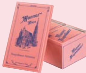
Manner Nostalgie Dose Manner nostalgia box Vienna Duty Free [22, 41, 45, 61] Gates F & G