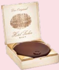
Original Sacher-Torte Vienna Duty Free [22, 41, 45, 61] Gates F & G