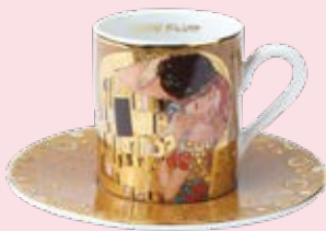
Espressotasse "Der Kuss" (Gustav Klimt) "The Kiss" espresso cup (Gustav Klimt) Tripidi [59] Gates G